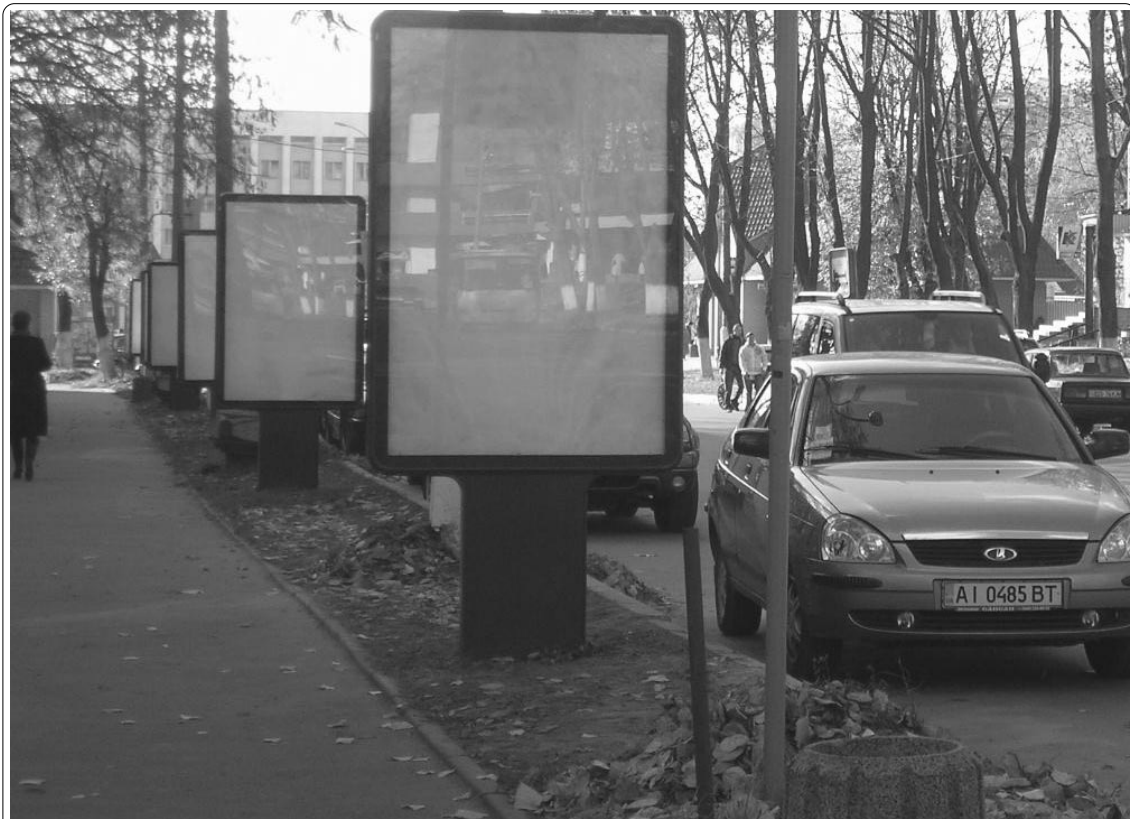
Вот такой интересный вид открывается водителю, желающему выехать между домами №4 и №6 на пр. Мазепы в г. Вышгороде...

любопытством, наш корреспондент присел и снял все, что просил водитель (см. фотографию).