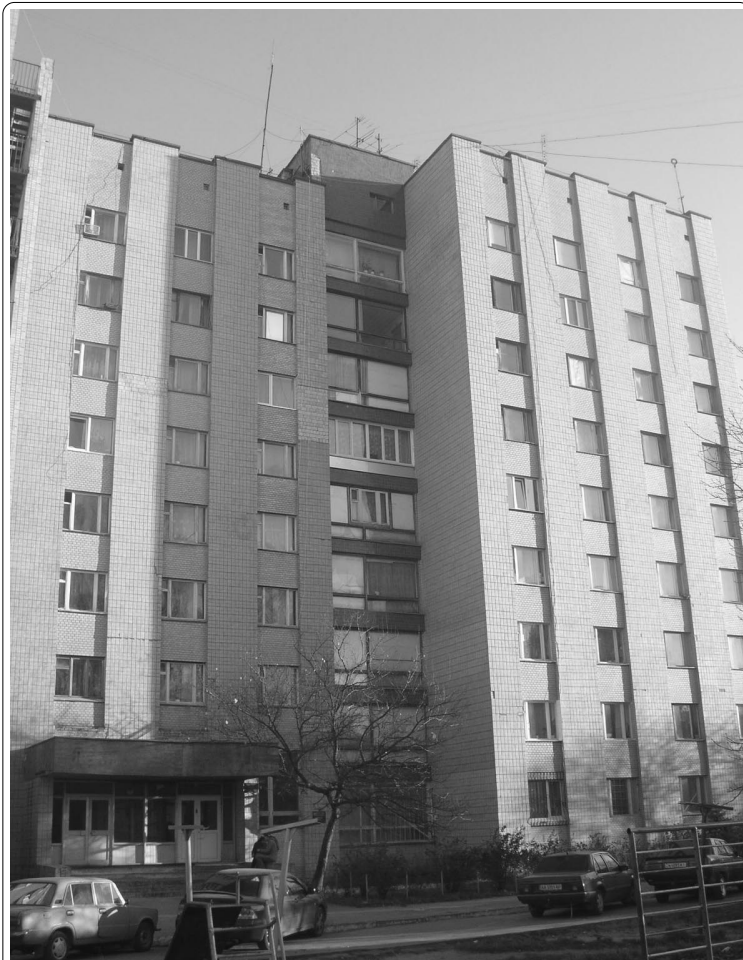
То самое общежитие...