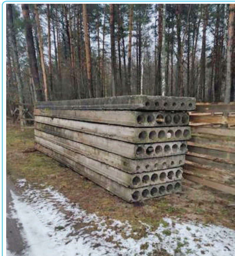
Приблизно так десять років тому виглядав об'єкт «цокольний поверх житлового будинку» готовністю 8%» об'єкту незавершеного будівництва (цокольний поверх житлового будинку) готовністю 8%».