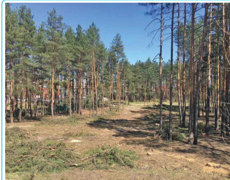
Тут буде дорога до нового будинку. В ордері №14 вказано, що знищенню підлягають 73 дерева. Насправі було знищено 93...